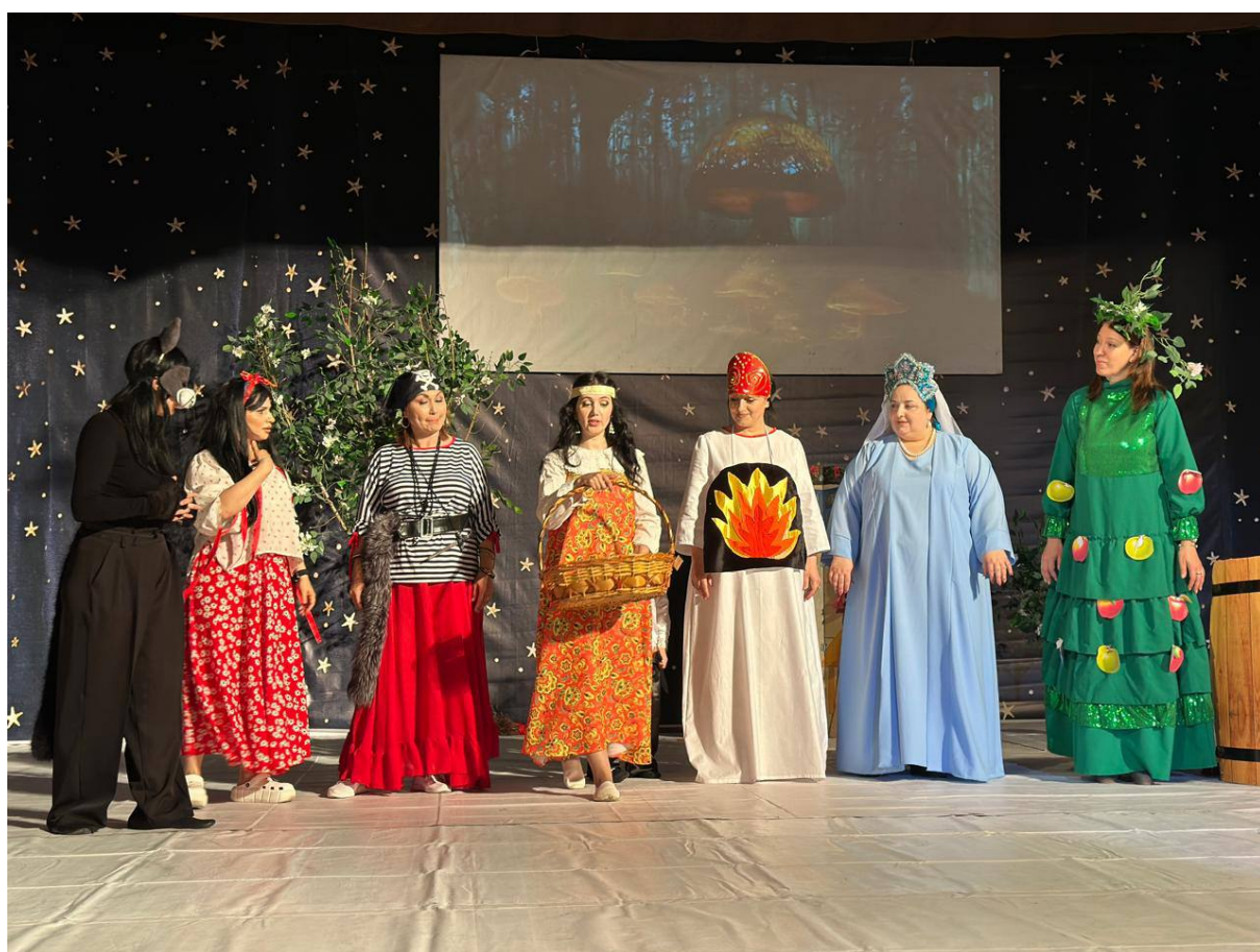
Участие в сказке