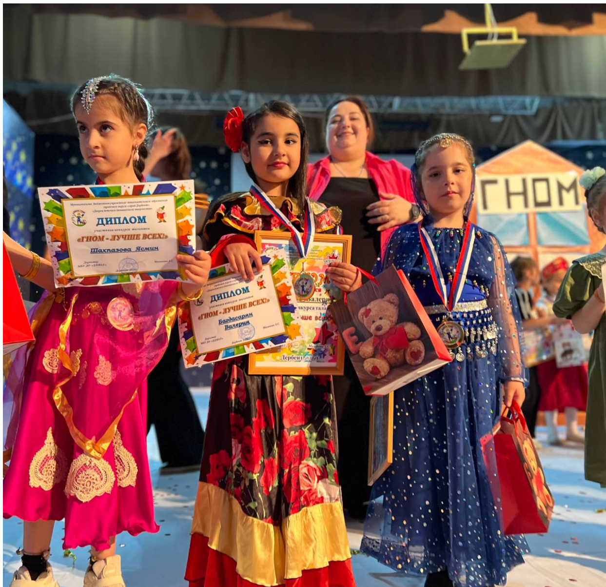
Конкурс «Гном лучше всех».