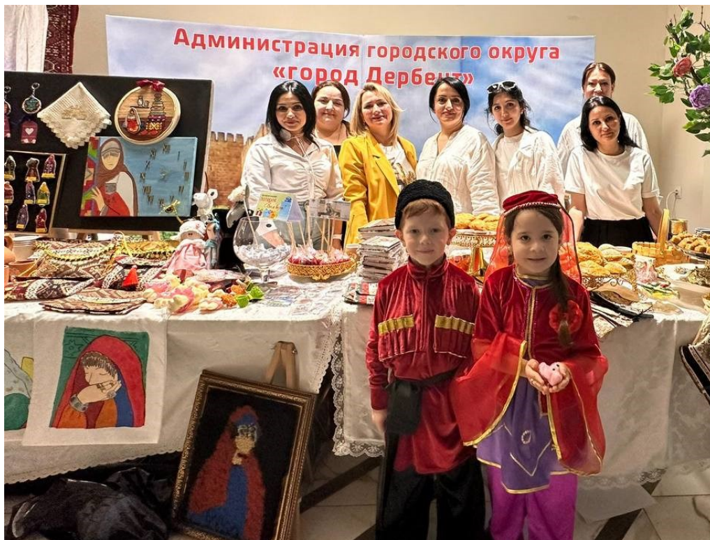
Участие в ярмарке посвященная «Новруз-Байрам»