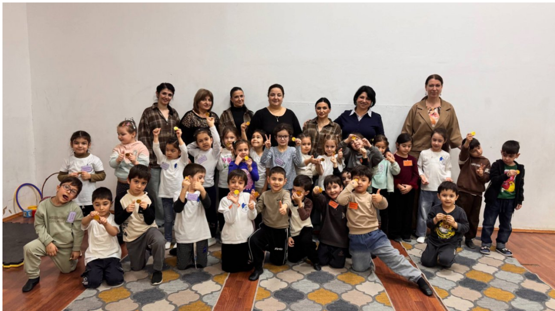
Интегрированное открытое занятие «Веселые старты», посвященное ко Дню защитника Отечества.