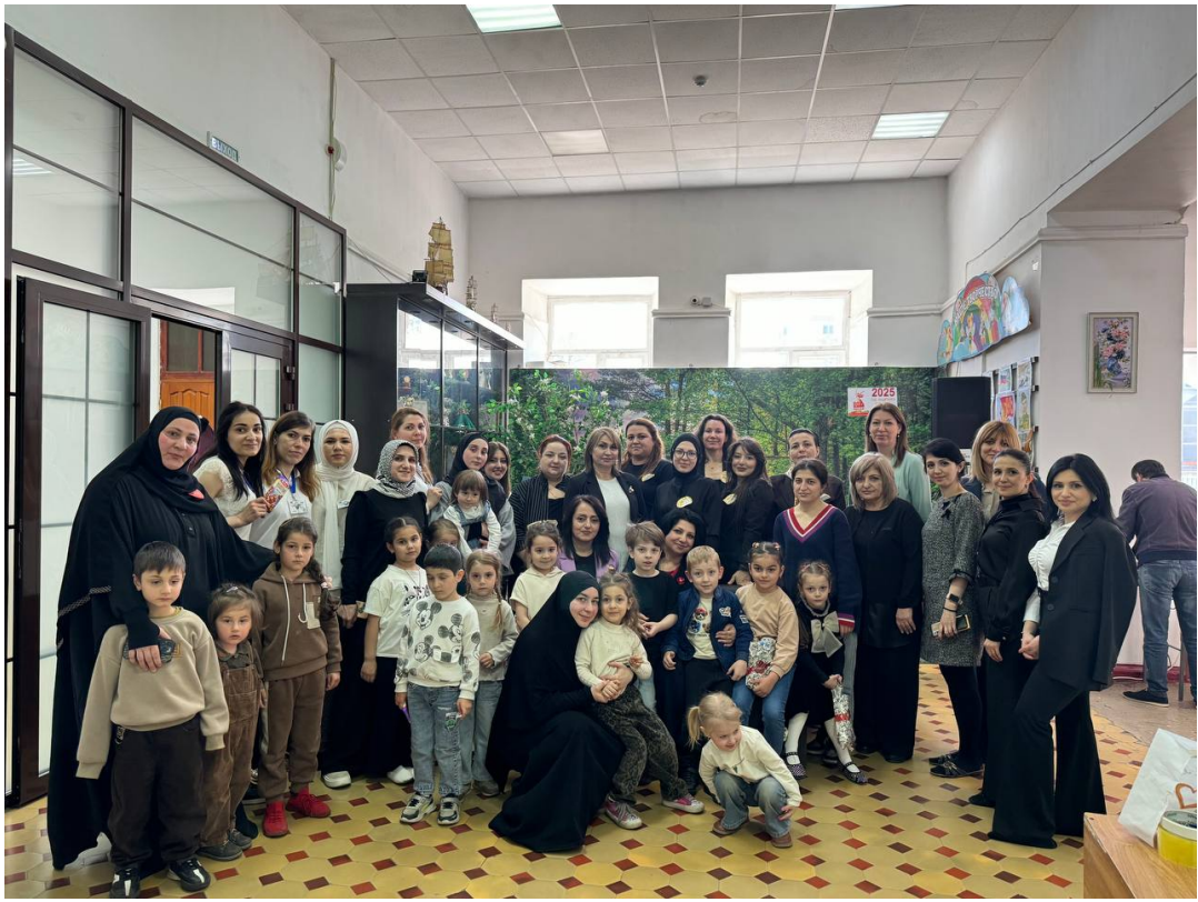
Конкурс «А ну-ка мамочки».