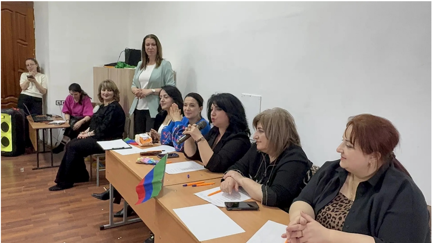
Наше компетентное жюри на конкурсе «А ну-ка мамочки».