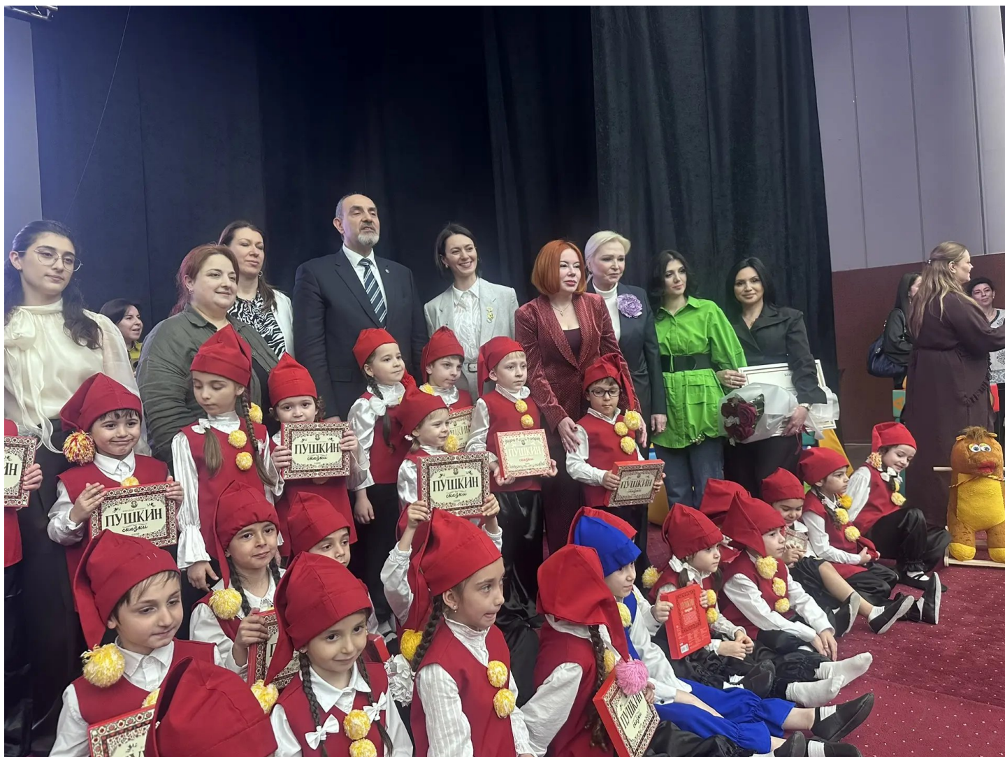
Участие в торжественной церемонии открытия Года дошкольного образования в Республике Дагестан