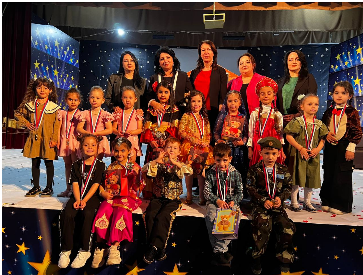
Конкурс «Гном лучше всех».