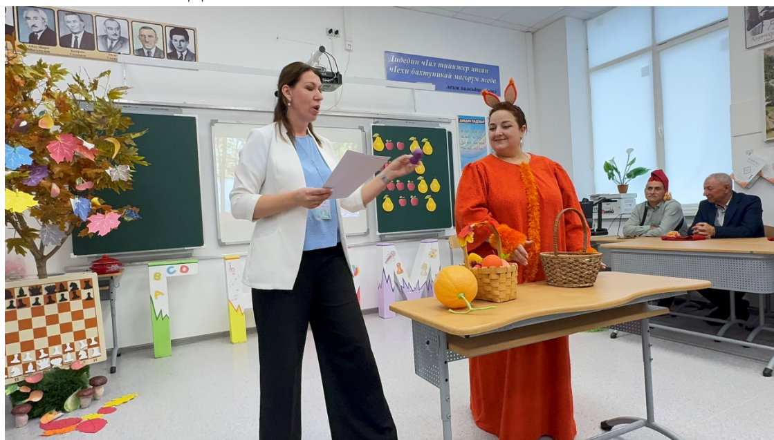
Участие в слете ассоциации педагогов Республики Дагестан.