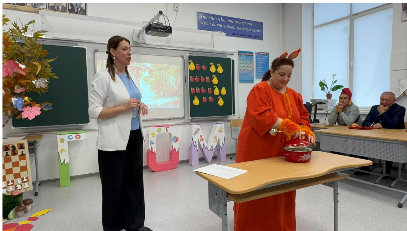
Участие в слете ассоциации педагогов Республики Дагестан